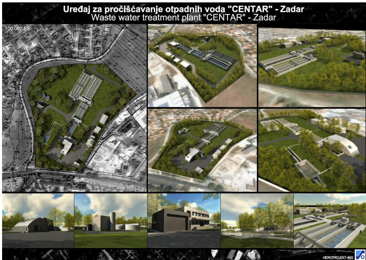
Slika 2. UPOV ZADAR-CENTAR I. FAZA (IZVEDENO)

Uslijedilo je izvođenje radova te puštanje uređaja u probni rad, otklanjanje nedostataka, završna ispitivanja i testiranja uređaja u radu sa otpadnom vodom u cilju dokazivanja projektnih kriterija i funkcionalnih garancija. Primopredaja uređaja u ruke Korisnika Odvodnje d.o.o. Zadar, kao i tehnički pregled izvršeni su u razdoblju konac 2010. - početak 2011. Uporabna dozvola ishodena je u studenom 2011.