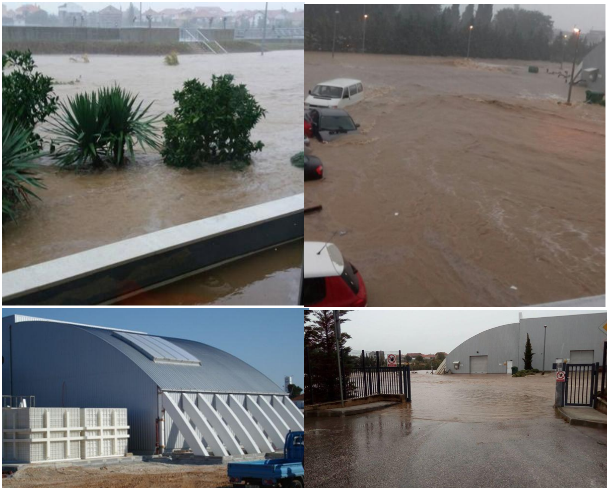
Slika 1. Lokacija UPOV-a, 11. rujan 2017.